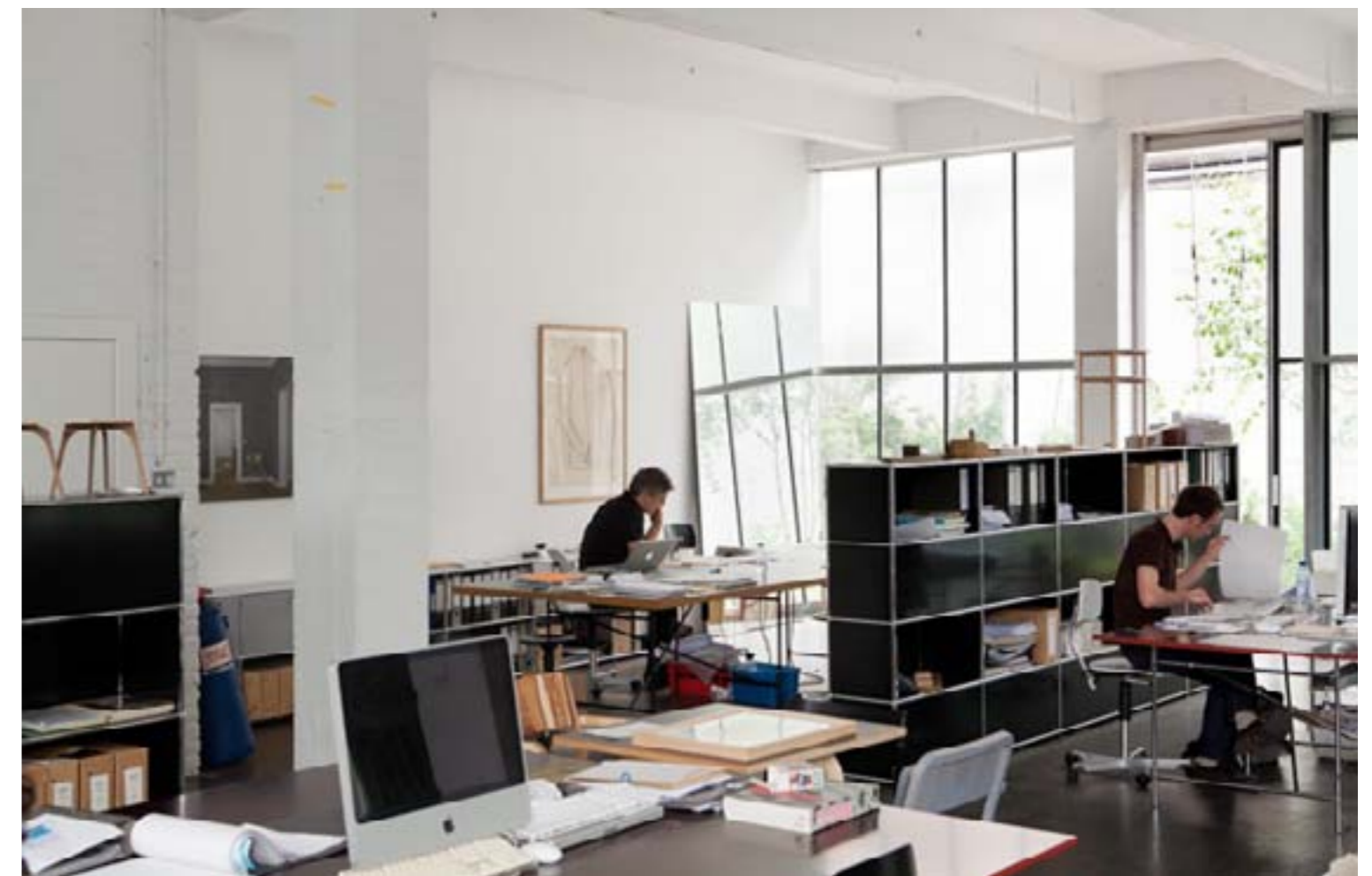
Tentoonstelling De Singel